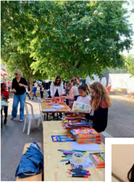
Le Grand Bain