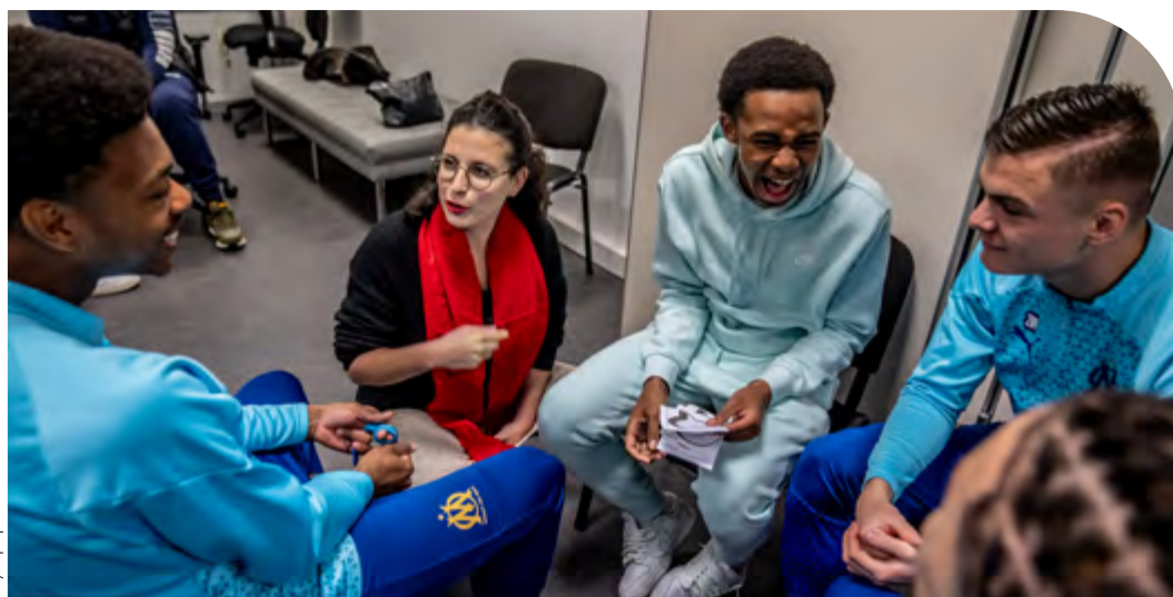
Olympique de Marseille

Dans ce contexte, il est essentiel de former les enseignants, notamment du 1 er degré, comme les animateurs en contact avec les enfants dans les temps péri et extrascolaires, qui se sentent souvent désarmés et inquiets pour aborder sereinement ces sujets, afin de garantir le cadre démocratique où se gèrent la pluralité des convictions, des religions et la liberté de conscience.