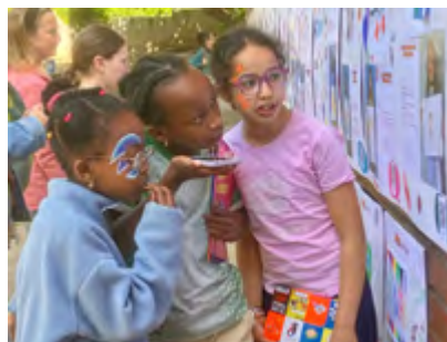
Le Grand Bain

L' École du nous , à Marseille, est une initiative de la Fabrique du Nous lancée en 2021, qui vise précisément à renforcer la cohésion sociale de la société à venir, en préparant davantage les nouvelles générations au "bien vivre ensemble" et, ce faisant, leur permet aussi de développer des compétences clés pour leur futur. Elle élabore et déploie des innovations pédagogiques afin de former une nouvelle génération qui dès le plus jeune âge apprend et vit l'altérité et change ses perceptions, grâce à la stimulation des 4C (dites compétences du XXI e siècle par l'OCDE) : Créativité, Critical Thinking, Communication, Coopération - incluant aussi l'Empathie.