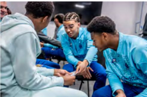
Olympique de Marseille