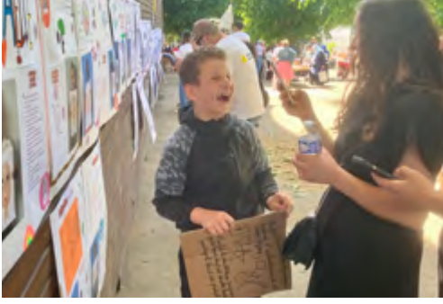
Le Grand Bain