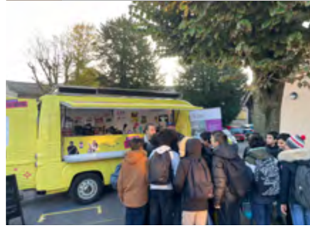
Lumières sur l'info