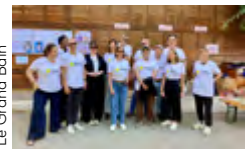
Le Grand Bain

Lien étroit avec l'université Aix-Marseille : Élaboration d'une étude sur deux ans pour évaluer l'impact de la mixité sociale sur les apprentissages.