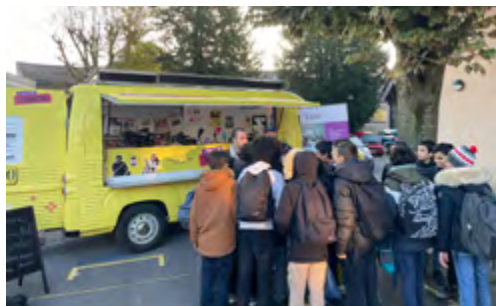
Lumières sur l'info