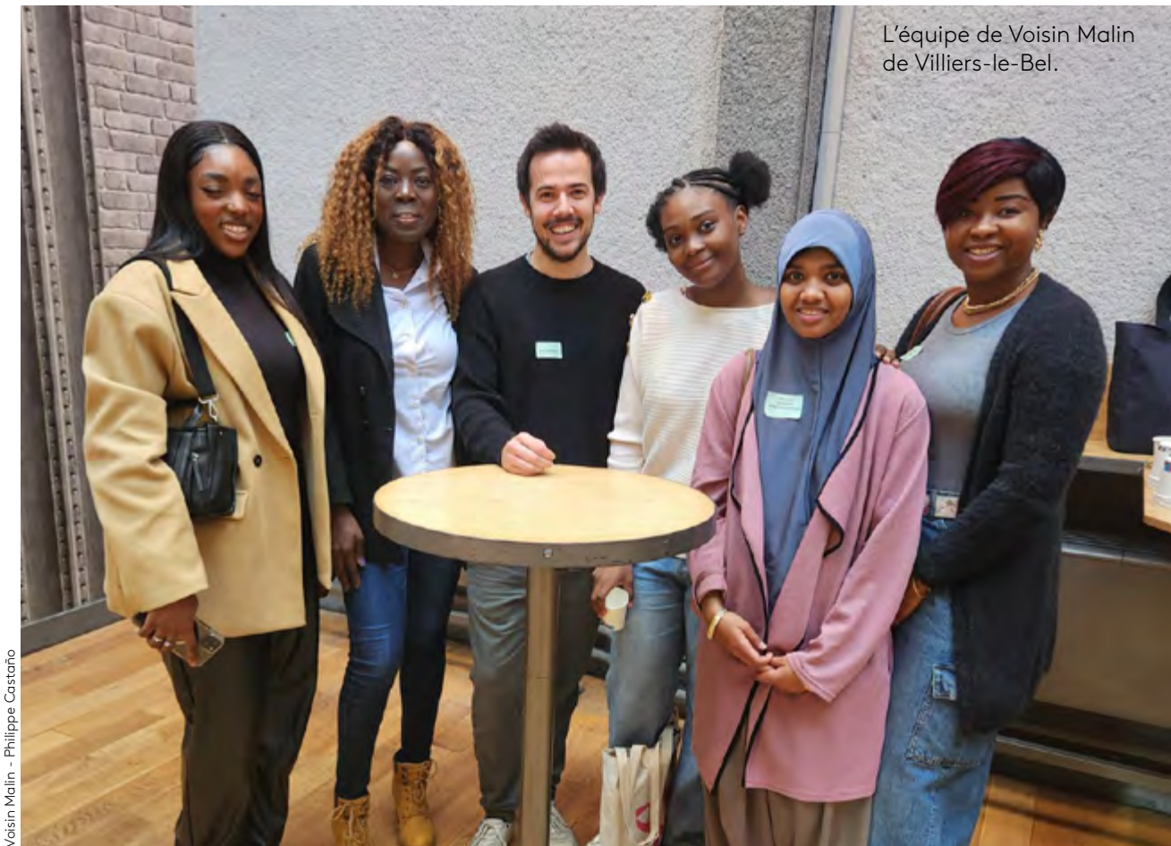
L'équipe de Voisin Malin de Villiers-le-Bel.