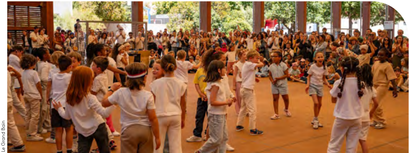
Le Grand Bain